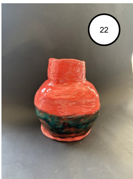
22. Saudade Amber Leegstra - 4VB

En zo vertelde de vaas: vrijheid is niet één vorm, niet één verhaal. Vrijheid is mogen bloeien zoals je bent, op jouw eigen manier.