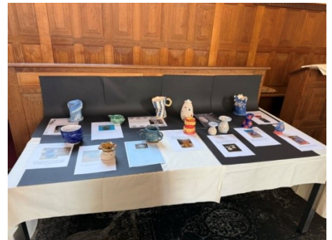
44 a. Tafel met vazen

Voor mij is vrijheid dat ik mezelf kan zijn zonder oordeel van anderen. Je ziet vrijheid terug in mijn vaas door de kleuren, de kleur blauw staat namelijk voor vrijheid, de kleur wit voor vrede en de kleur goud voor succes.