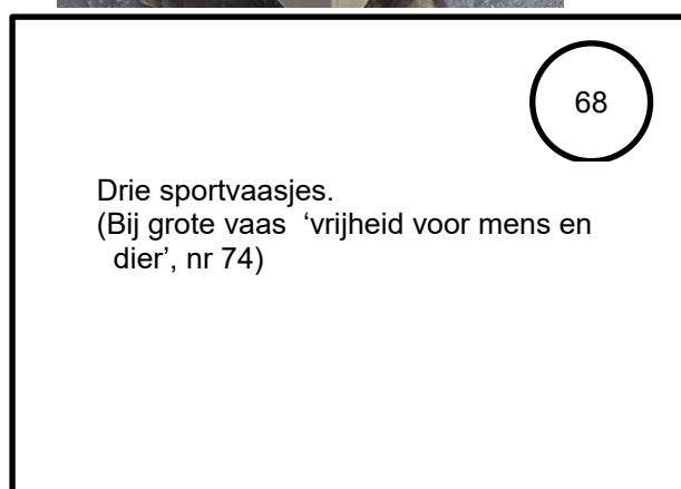
Drie sportvaasjes. (Bij grote vaas 'vrijheid voor mens en dier', nr 74)