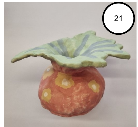
21. Vrij om te bloeien Tineke Terpstra – 5VB

Deze vaas symboliseert vrijheid in zijn puurste vorm. De opening in het midden laat ruimte, een lege plek die ademt, die niets opsluit. Het glanzende, organische rood weerspiegelt leven en beweging, terwijl de onregelmatige vorm laat zien dat vrijheid niet perfect of symmetrisch hoeft te zijn. Vrijheid betekent ruimte om te zijn wie je bent, in al je vormen en kleuren. Zoals deze vaas niet gevangen zit in een standaard vorm, zo zouden ook wij niet vast hoeven te zitten in verwachtingen. Open, onvolmaakt en vrij.