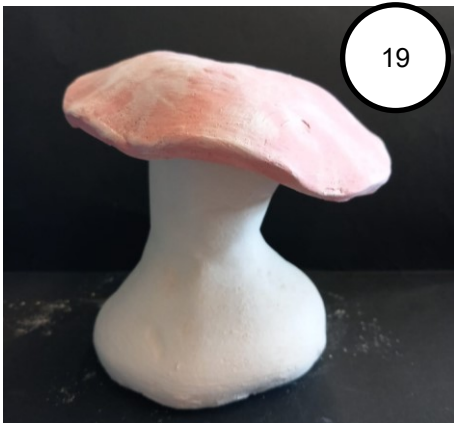
19. Paddenstoel Brechtsje Andringa - 4HA

Paddenstoelen, vaak over het hoofd gezien in de natuur, kunnen een verrassende link met vrijheid vertegenwoordigen. Hun vermogen om te groeien op onverwachte plaatsen en in verschillende vormen symboliseert de vrijheid om conventies te doorbreken en nieuwe paden te bewandelen. Hun diversiteit en aanpassingsvermogen herinneren ons eraan dat vrijheid vele vormen kan aannemen en overal te vinden is, zelfs in de kleinste hoekjes van de natuur.